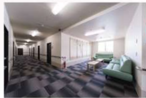
談話室 2階にはゆったりと会話をを楽しむ談話室をご用意致しました

私達、ケア・コラボレートK・H 介護保険事業所土筆は、ひとりひとりの笑顔の為に、サービス付き高齢者向け住宅を開設致しました。 詳細は、以下の通りでございます。住まいのタイプは3タイプ、各々の現状に合わせたご入居が可能です。安心して住んで頂ける高齢者住宅とゆとりのある暮らしを実現させるサポートシステムをご提供いたします。入居者募集要領、その他ご不明な点は、直接電話でお問い合わせ頂くかHP上のお問い合わせフォームよりお問い合わせください。