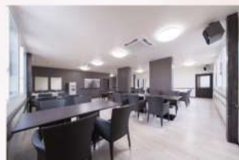
食堂 広々とした明るい食堂で楽しくお食事を楽しましむ事が出来る様に配慮致しました