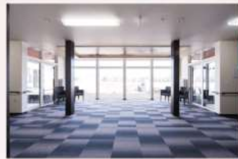
ホール 日本庭園を望むことのできる明るいホールをご用意致しました